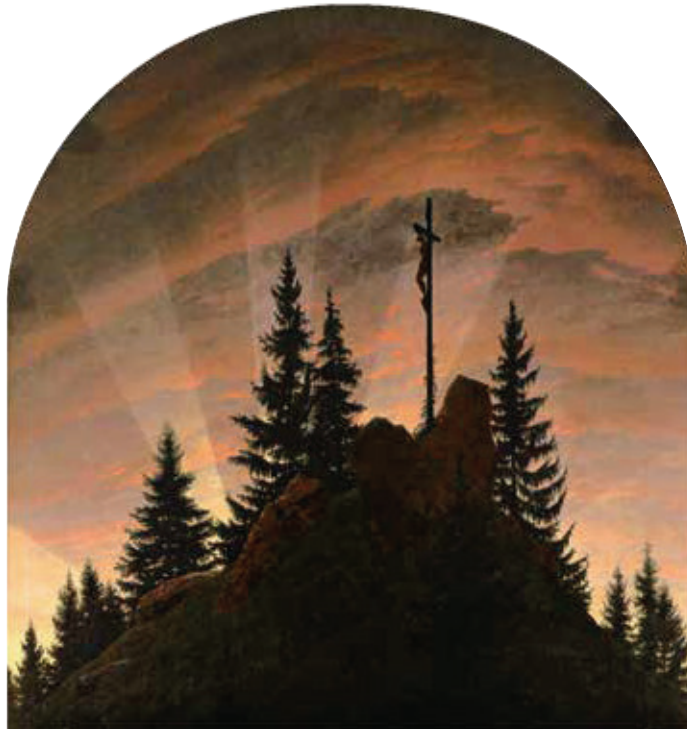
Auf dem Tetschener Altar von Caspar David Friedrich (1807/1808) wendet sich Christus vom Betrachter ab und der Vergangenheit, der untergehenden Sonne, zu. Die Fichten erklimmen den Berg als Vorbote einer ungewissen Zukunft.

ihn war die Fichte der marschierende Vorbote unaufhaltsamer Veränderungen nicht nur des Waldes an der Schwelle zur Waldbauzeit durch die ›rationelle Forstwirtschaft‹, sondern des tiefgreifenden Wandels der heimatlichen Landschaft und des