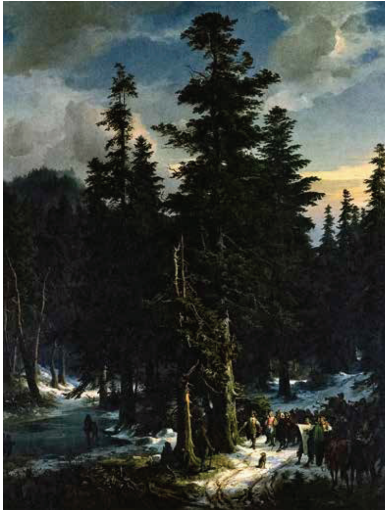
Unter Fanfarenstößen wird die Axt an eine der letzten mächtigen Weißtannen im Thüringer Wald gelegt. Friedrich Preller der Ältere, Fällung des ersten Baumes für den Schlossbau, Mitte des 19. Jahrhunderts.