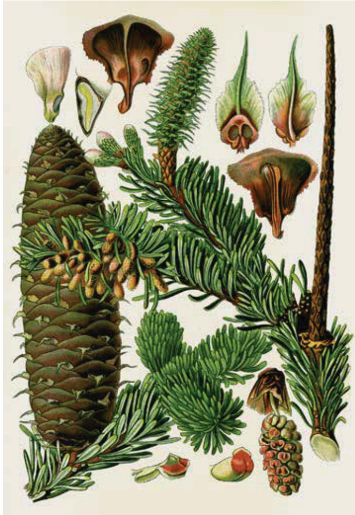
Sind die Samenschuppen der Tanne verweht, ragt allein die nackte Spindel in den Himmel. Der Zeichner verwechselte hier allerdings den Weißstannenzweig mit dem der Pazifischen Edeltanne, um 1885.