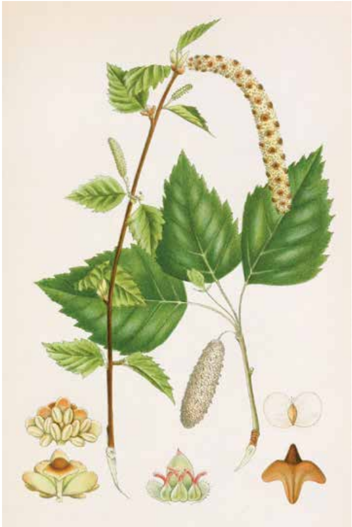
Einhäusig getrenntgeschlechtlich: Botanische Darstellungen zeigen oft je einen Zweig mit männlichen Kätzchen und weiblicher Blüte, dazu Querschnitte von Blüte, Fruchtknoten und geflügelter Nussfrucht.