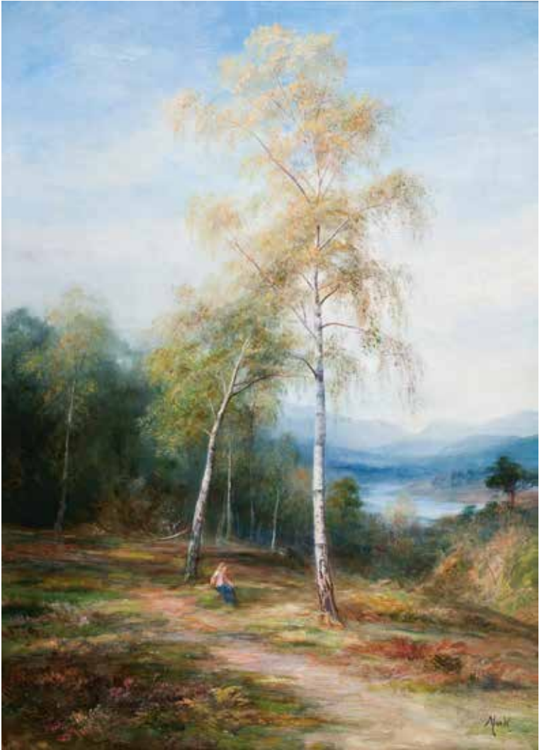
Die Birke, ein zarter, heller Baum, tröstet, regt zum Träumen an und weckt Vorstellungen vom Einswerden mit der Natur, bei John MacWhirter heißt sie: Braut des Waldes.