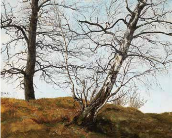
Die weiße Rinde ist ein Merkmal, an dem die Birke leicht zu erkennen ist, wie hier auf dem Bild von Carl Julius von Leybold: Birke und Eiche im Frühling, 1832.

Ich kletterte nach oben, bis der Stamm schwankte, weiter wagte ich mich nicht hinaus. Mir genügte das kontemplative Sitzen im Geäst, das leichte Schaudern beim Schaukeln des Stamms und die Aufregung, vom Wispern des Windes umfungen zu sein. Ich war nicht so mutwillig, das Biegen der Birke zu riskieren. Viele Jahre später spürte ich eine starke innere Bewegtheit, als ich auf das Gedicht Birches des amerikanischen Dichters Robert Frost stieß. Es erzählt von Kindern, die auf Birken klettern, aus Spiel- und Risikofreude bringen sie die Birken zum Schaukeln und fordern ihre Elastizität so lange heraus, bis