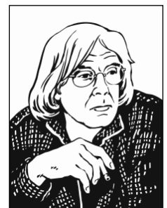
Information Maren Block

624 Seiten, geb. mit Schutzumschlag ISBN 978-3-88221-656-1 Euro 29,90 / CHF 49,90