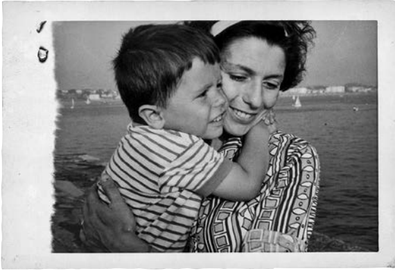
Mit Mutter und Vater in Biarritz