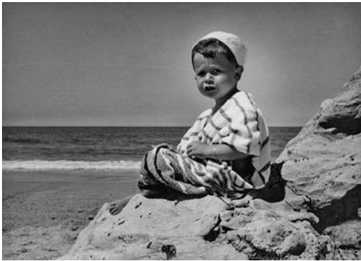
In Biarritz, 1960