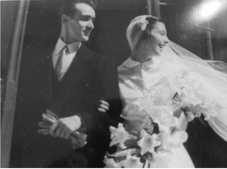
Hochzeitsfoto der Eltern, 1952