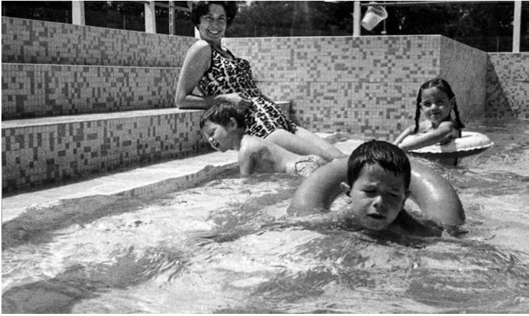
Im Schwimmbad in Cazères, 1962