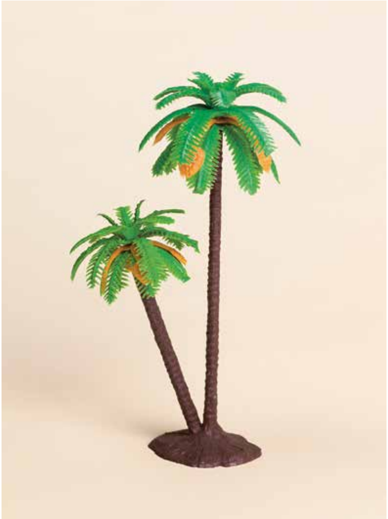
Plastische Ideale: Diese Palmen sind Teil einer reichhaltigen Sammlung, die die Fotografin Nele Gülck in Der Baum des Paradieses portraitiert hat.