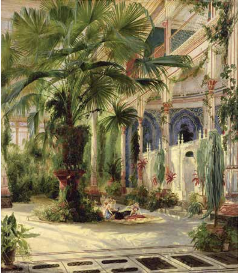
Preußische Palmen: Carl Blechen malte Das Innere des Palmenhauses auf der Pfaueninsel zwischen 1832 und 1834.